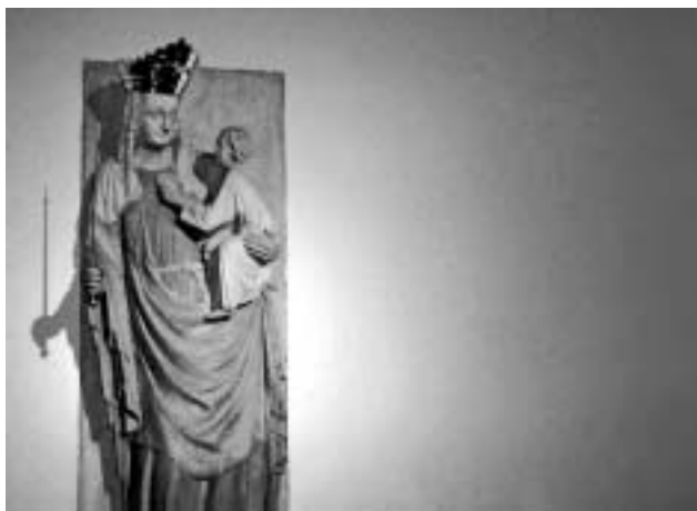
Die Schiffer-Madonna im linken Kreuzarm unserer Pfarrkirche.

Es ist verständlich, dass es anfangs starken Widerstand gegen diesen Titel gab. Manche schlugen vor, von „Christusmutter“ zu sprechen, aber nicht von Maria als die Mutter Gottes.