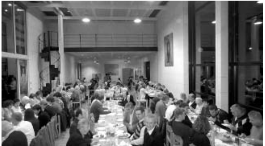
Helferabend im Pfarrsaal

Eigentlich schade, wenn unsere Zeit eine Pfarrgemeinde nicht mehr danach bemisst, was sie zum Lob Gottes anbietet, sondern was sie für die Mitmenschen tut. Beides gehört doch zusammen. Auch wenn wir kein Sozialverband sein wollen, unser Dienst am Nächsten kann sich sehen lassen. Er verwirklicht sich in vielen konkreten Diensten und Bereitschaften, in nachbarschaftlichen Aushilfen, in Sammeln und Spenden für Menschen in Not. Unsere Überweisungen in die Dritte Welt (Mission) gehen jährlich in die Hunderttausende.