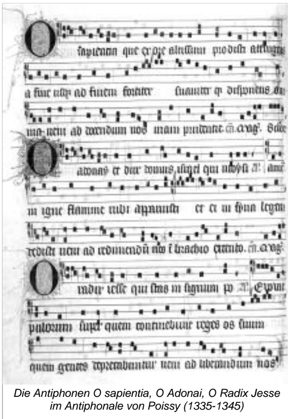
Die Antiphonen O sapientia, O Adonai, O Radix Jesse im Antiphonale von Poissy (1335-1345)

O Emmanuel, Gott mit uns. Du König und Lehrer, du Sehnsucht der Völker und ihr Heiland. Komm, o Herr, und erlöse uns, Herr, unser Gott.