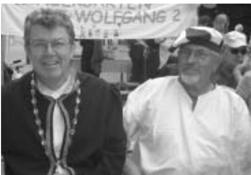
Impres- sionen vom Mittel- alter- fest