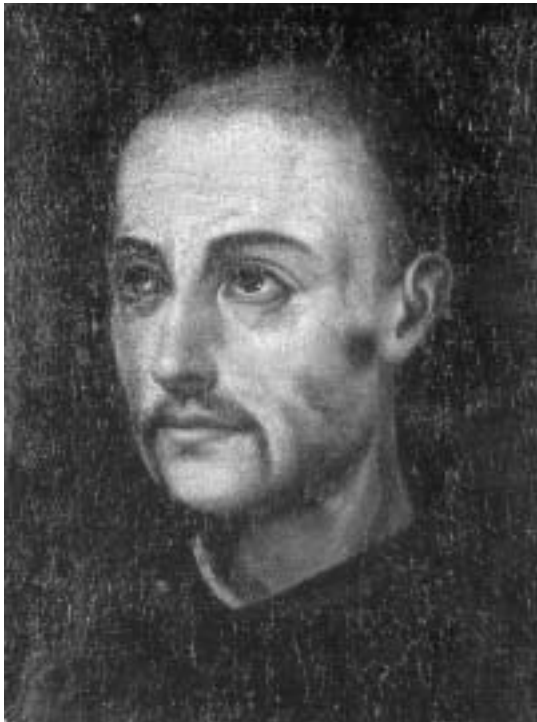
Hl. Johannes von Gott Ölgemälde von Pedro de Raxis

Joao Ciudad Duarte wurde 1495 in Portugal geboren. Nach einem abenteuerlichen Leben als Hirte, Buchhändler, Tagelöhner und Soldat findet er mit über 40 Jahren sein Lebensziel, indem er sich mit aller Intensität der Pflege von geistig und körperlich Kranken widmet. Bereits jetzt erhält er den Beinamen Johannes von Gott. In Granada gründet er Hospitäler und eine Laiengemeinschaft, aus der heraus sich schließlich der Orden der Barmherzigen Brüder entwickelt.