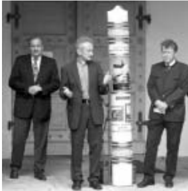
Empfang der Jubiläumskerze in St. Vitus

Das Jahr neigt sich dem Ende entgegen. Römer im April, Mittelalter im Juli, Neuzeit im September – unsere ideenreichen Stadtteilfeste waren ein voller Erfolg; dazu trug natürlich auch das Wohlwollen von „ganz oben“ bei, denn das Wetter konnte an diesen drei Festwochenenden nicht besser sein. Festgottesdienste, Konzerte, Vorträge, Geschichtsquader, Hymne, Kerze, Festschrift – vieles bleibt in guter Erinnerung.